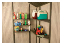
kit d'étagères Réf 115